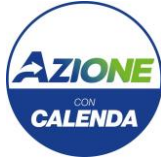
Gruppo Consiliare Azione