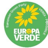
Gruppo consiliare Europa Verde Verdi Possibile