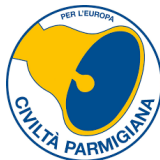
Gruppo Consiliare Civiltà Parmigiana