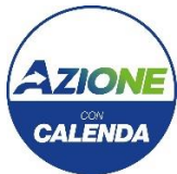
Gruppo Consiliare Azione