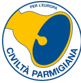
Gruppo Consiliare Civiltà Parmigiana