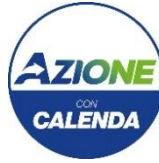
Gruppo Consiliare Azione